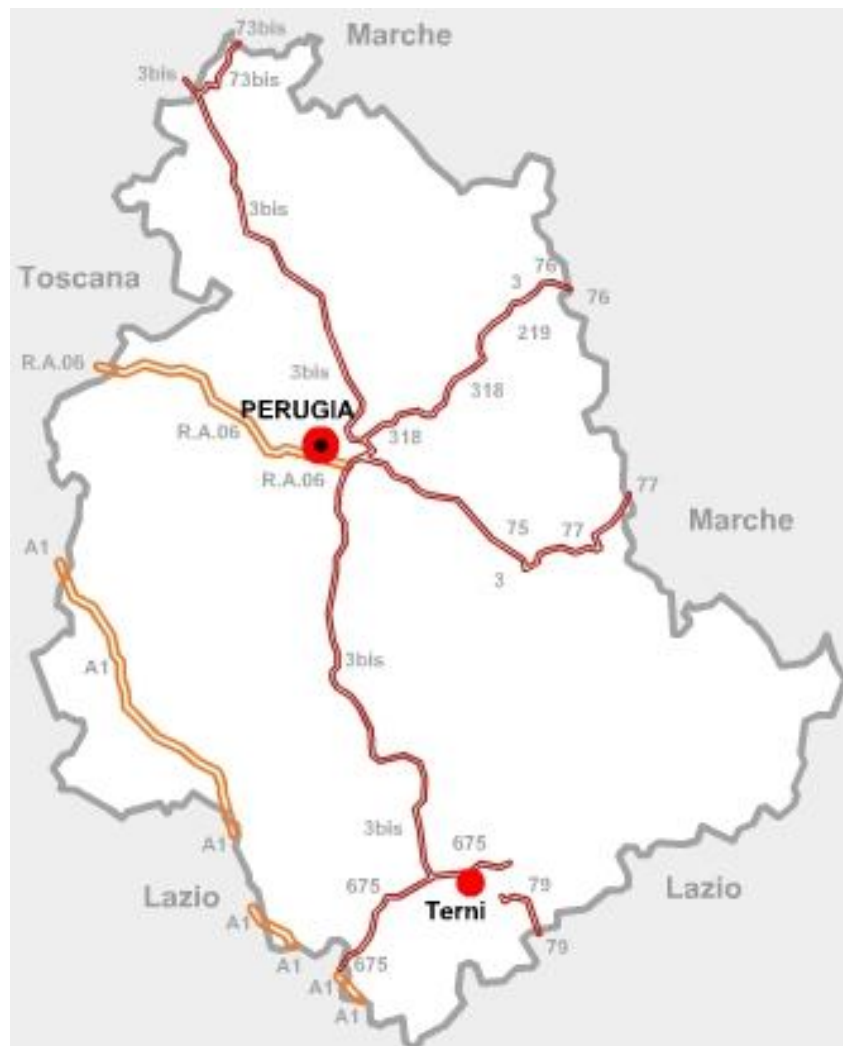
Grafico B – Strade statali Umbria

cartografia: materiale reso disponibile da Anas.