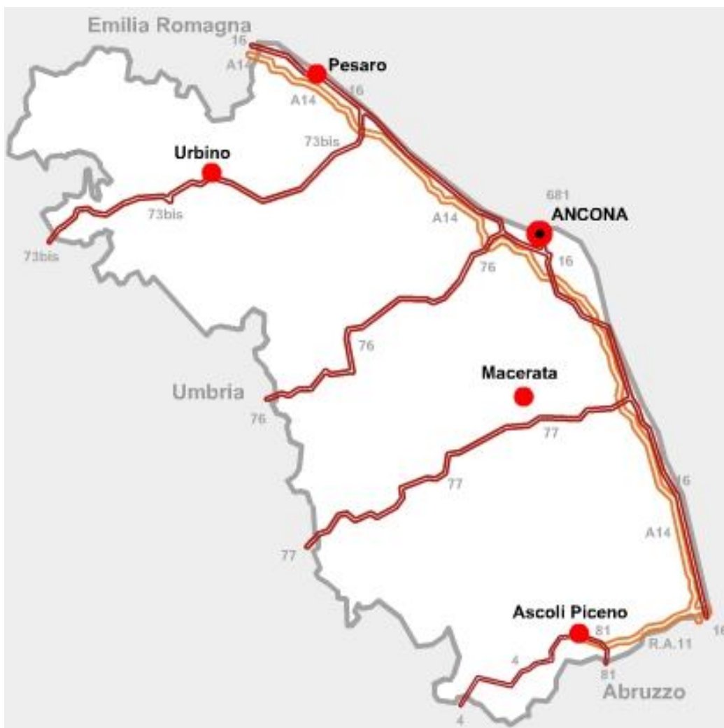
Grafico A – Strade statali Marche

cartografia: materiale reso disponibile da Anas.